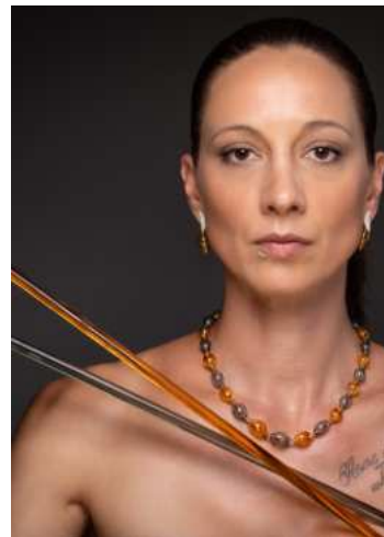
bis zum fertigen Produkt